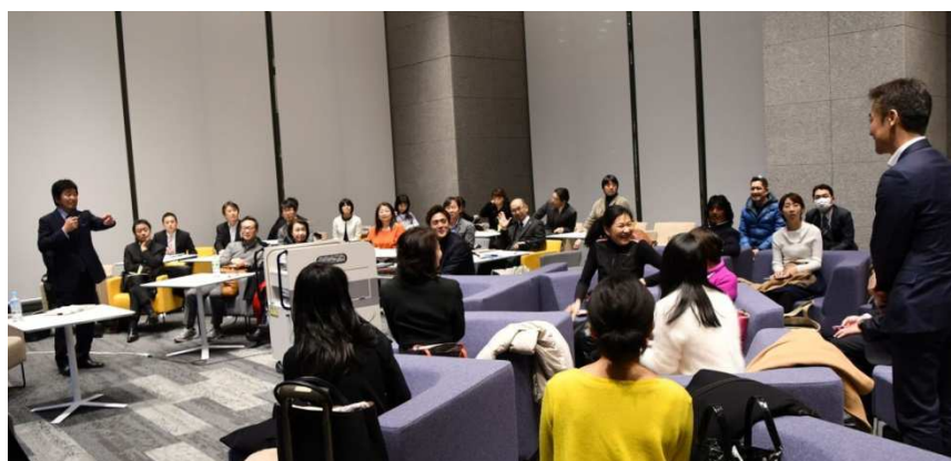
開催の様子（プレイベント）