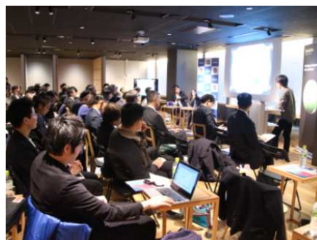
イベントイメージ（SENQ 霞が関）