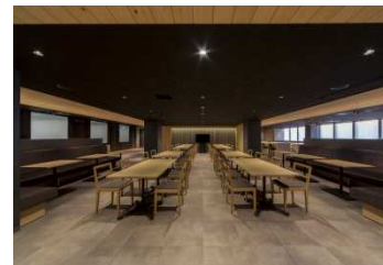
サロン (イベントスペース)