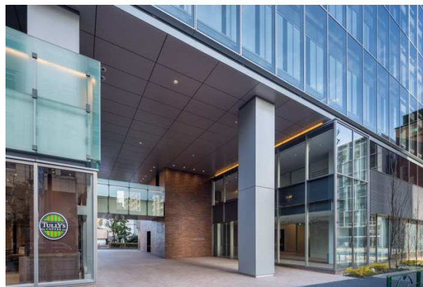
二層吹き抜け貫通路（1階）