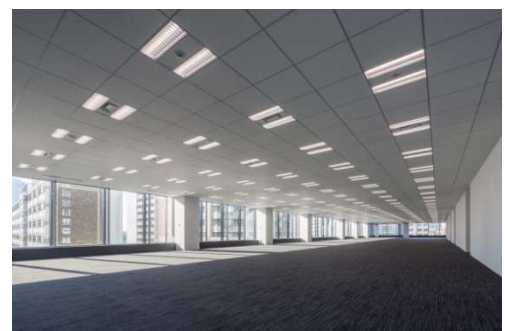
開放感あふれるオフィスフロア（基準階）