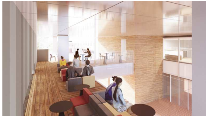
オープンエアオフィス