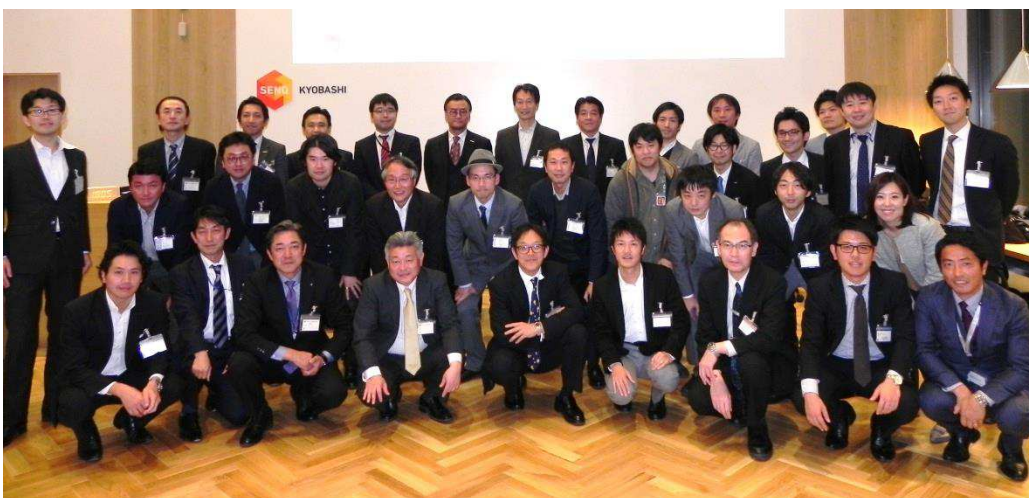
メンター・アライアンスパートナーの皆さん（2016年11月10日 SENQ 京橋にて）

「SENQ」シリーズ第一弾は、本年 11 月 25 日にグランドオープン予定の京橋エドグラン内にて、「食」をテーマとしたオープンノベーションオフィス「SENQ 京橋」を開業します。また、2017 年 2 月には「SENQ 青山」と「SENQ 霞が関」の開業を予定しています。今後も首都圏を中心に拠点展開し、入居者のオープンノベーション支援を通じて、これまでにない“SENQ 発”のサービスやプロダクト等のビジネスの創出を目指します。