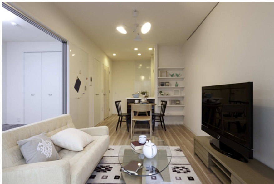
個室 (イメージ写真)