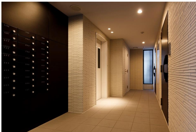
1階共用部 (メールボックス・宅配ボックス設置)