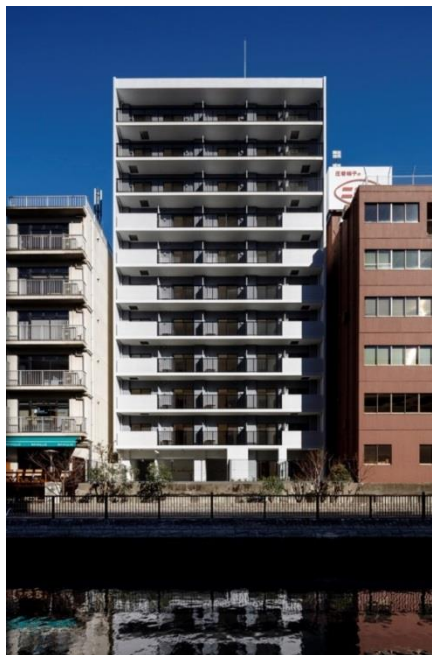
外観 (南面 運河側)