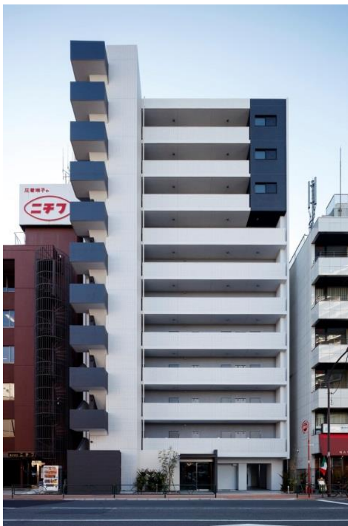
外観（北面 エントランス側）