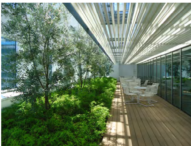
11階ガーデンテラス植栽