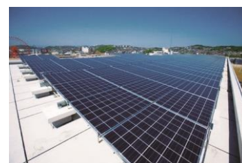
太陽光発電パネル

「CASBEE横浜」（建築環境総合性能評価システム）において「Brillia City 横浜磯子」は、K棟を除く全ての住宅棟が最高評価のSランクとなりました。（※K棟はSランクに次ぐAランクの評価でした。）