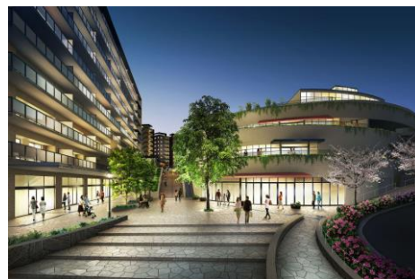
ヒルトップモール

敷地内には、スーパーマーケット（マルエツ）、ドラッグストア（ハックドラッグ）、クリニックモール（内科・小児科・歯科・耳鼻咽喉科・調剤薬局）、認可保育園（にじいろ保育園）、カフェ（ヴィレッジカフェ）、美容院（LAWRENCE）、個別指導塾（CGパーソナル）、コンビニエンスストア（セブンイレブン）、セキュリティステーション（ALSOK）が3月1日より順次開業予定で、居住者の日常生活をサポートします。