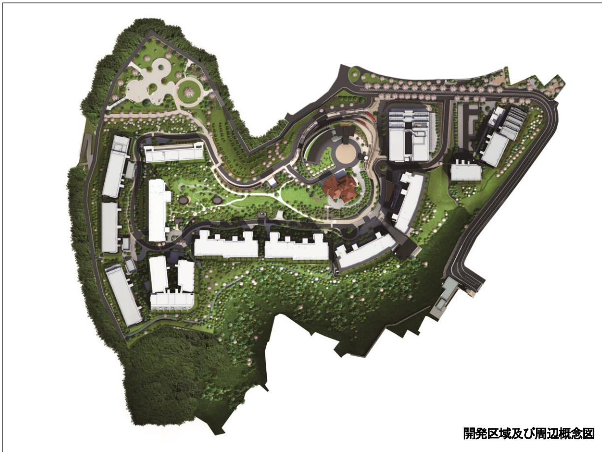
開発区域及び周辺概念図

海を見下ろす丘の上に誕生する「Brillia City 横浜磯子」は、森からの風と潮風が同時に感じられる自然環境が大きな特徴となっています。この恵まれた環境を最大に生かし、約10haという広大な敷地の約75%を空地にすることで広大な緑地を生み出し、開放感あふれる空間と豊かな緑が広がります。