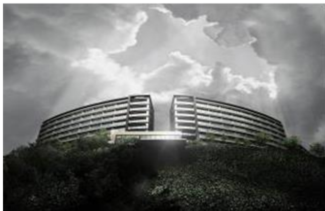
「Brillia City 横浜磯子」I・J棟 外観完成予想図

（※1：平成 20 年 1 月～23 年 7 月末までに首都圏（東京都、神奈川県・千葉県・埼玉県）で供給された新築マンションを対象。（有）MRC 調べ）