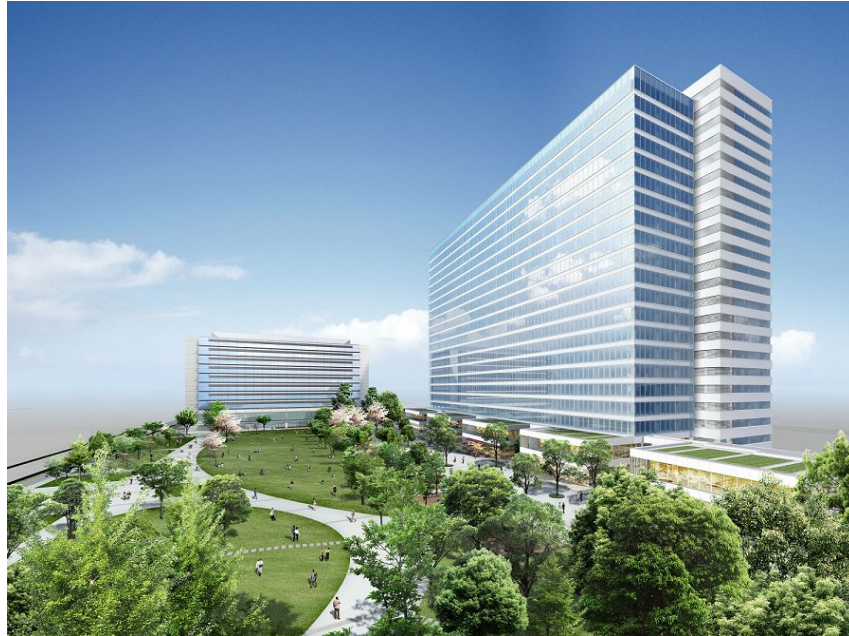
中野セントラルパーク・中野四季の森公園