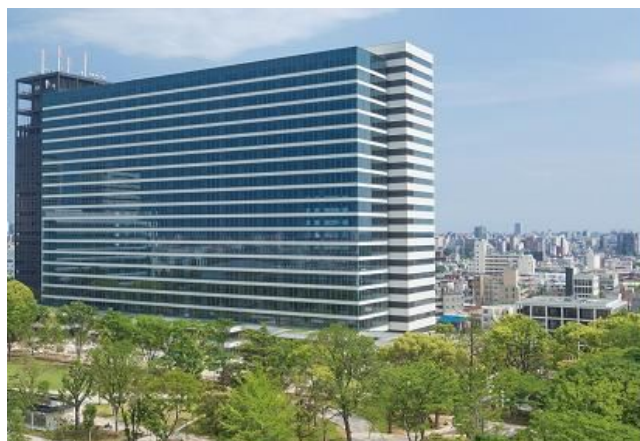
サウス・レジデンス 外観

同時に竣工した「中野セントラルパークレジデンス(住宅棟)」は、専有面積約43㎡~130㎡の賃貸住戸計17戸で構成されており、本年6月より入居者の募集を開始しております。