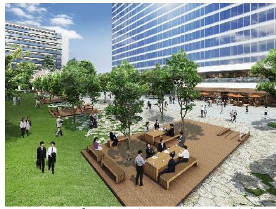
プロムナードに設置されたウッドデッキ