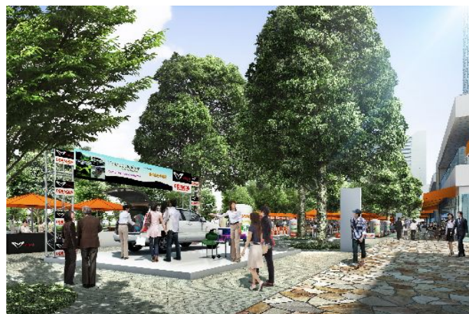
イベントイメージ