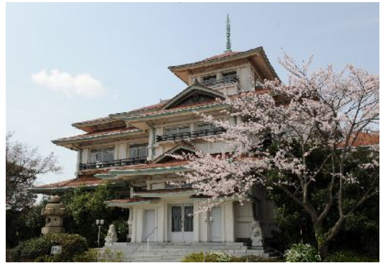
リニューアルし、保存される貴賓館