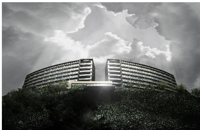
I・J棟外観完成予想図